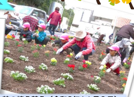
花の植え替え (令和3年11月9日)