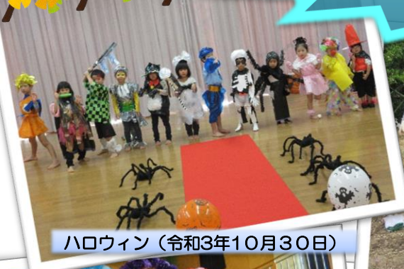
ハロウィン (令和3年10月30日)