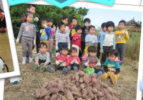
芋ほり (令和3年10月14日)