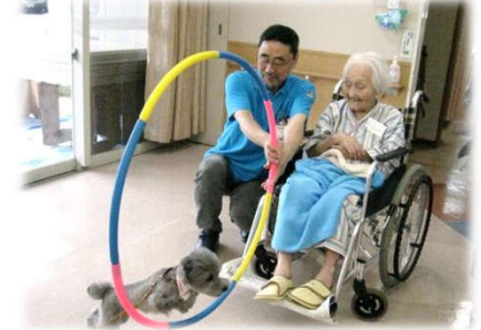
文責：総務課・大石