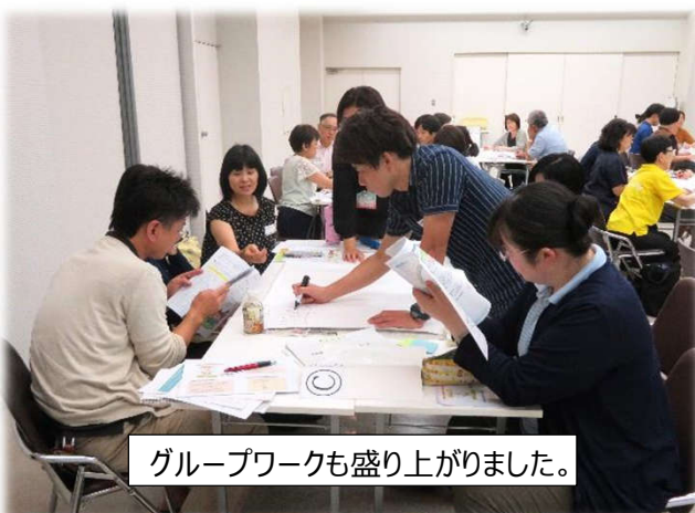
グループワークも盛り上がりました。