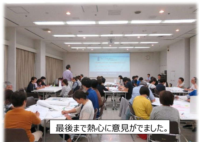
最後まで熱心に意見ができました。